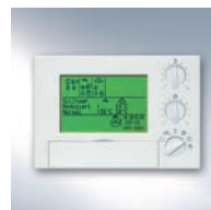
Regulator pompy ciepła z systemem komunikacji i zdalnym monitoringiem