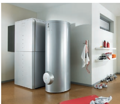
Vitocal 300-A typ AWC-I do pracy wewnątrz budynku, z ustawionym obok podgrzewaczem c.w.u. Vitozell 300-B