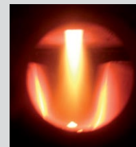
Proces zgazowania drewna w komorze spalania