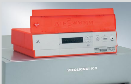
Vitoligno 100-S 25 do 40 kW

Regulatory Vitotronic – technika, która myśli